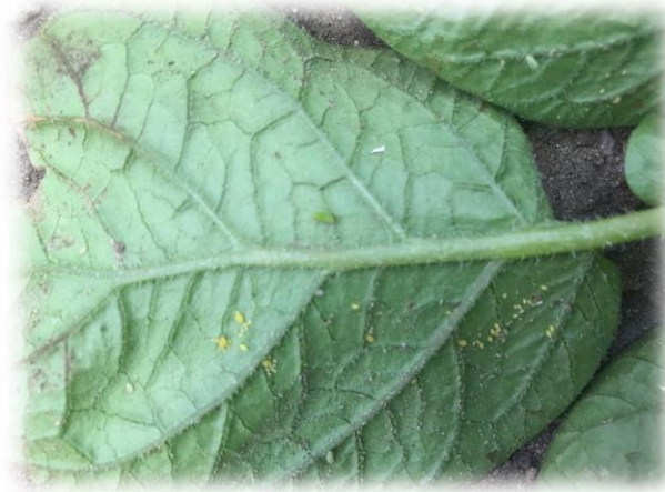
Löss på undersidan av ett småblad.