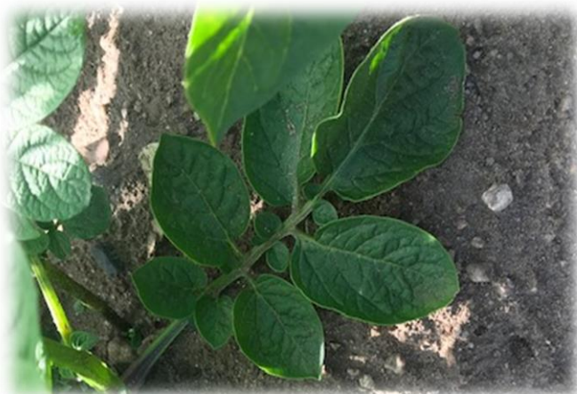
Äldsta storbladet är där man enklast hittar lössen (består av 7-9 småblad).

Bekämpningsrekommendation: 0,16 Teppeki (endast effekt på bladlöss)